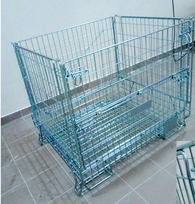
Фото модель F5