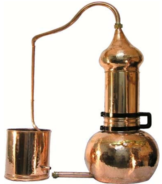
Фото 1. Аламбик с колонной

В последнем случае можно резко увеличить сопротивление пару и произвести ректификацию высокопроцентного нейтрального спирта. При повторном заполнении котла спиртом и помещении в колонну трав или ягод можно получить высококачественную травяную или ягодную настойку.