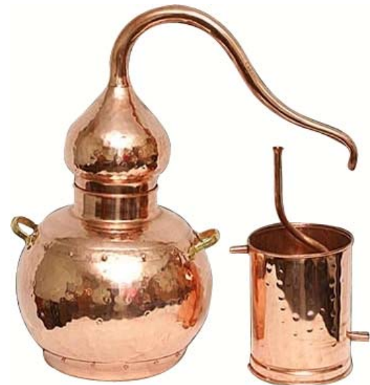
Фото 2. Аламбик без колонны